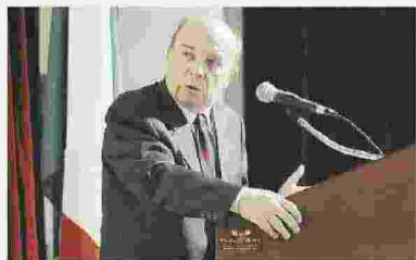
TRAVAGLIO A PAG. 4-5

“L’Aventino renziano è vagamente eversivo: giusta l’intesa Pd-M5S”