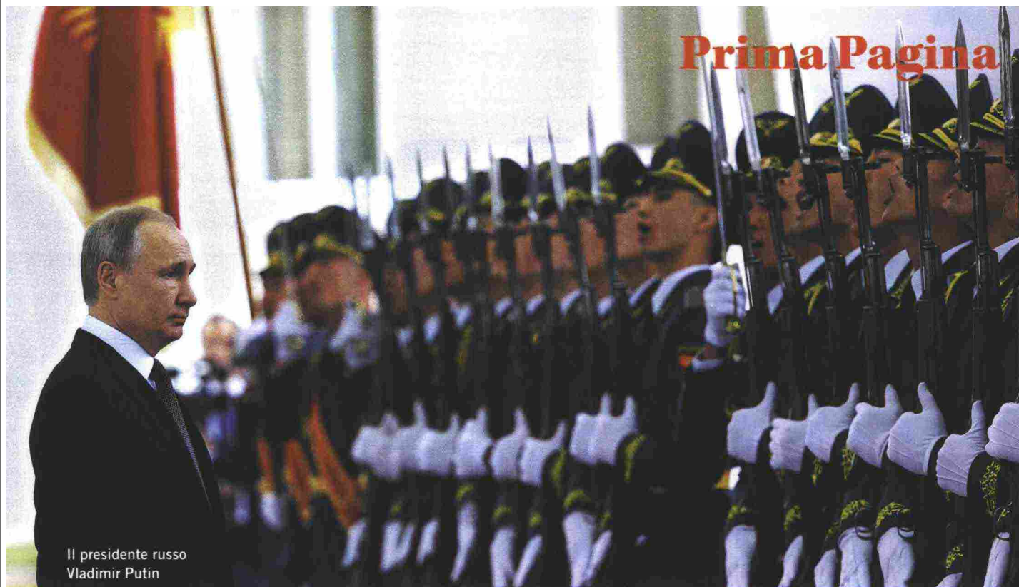
Il presidente russo Vladimir Putin

mo già stati condannati per la nostra presunta omofobia. Non abbiamo problemi con le persone Lgbt (lesbiche, gay, bisessuali, transgender, ndr). Che vivano come vogliono. Ma alcune cose ci sembrano eccessive. C'è chi sostiene che i bambini possono svolgere cinque o sei ruoli di genere. Non so dire nemmeno esattamente quali generi siano, non ne ho idea... Lasciamo che tutti siano felici, non abbiamo alcun problema, ma non dobbiamo permettere che ciò metta in secondo piano la cultura, i valori familiari tradizionali».