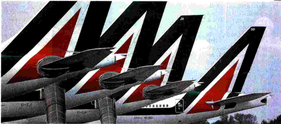
Alitalia. Pubblicato il decreto con la costituzione della Newco