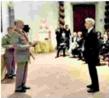
▲ La cerimonia per la consegna della Legion d'onore ad Augias