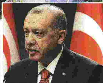
Dalla Turchia al Pakistan Sopra il leader turco Erdogan. Sotto manifestanti bruciano un'immagine del presidente Macron in una strada di Quetta, in Pakistan