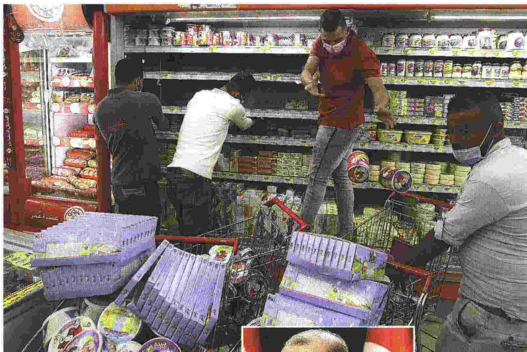
Via dagli scaffali Prodotti francesi rimossi in un super di Amman

● Macron a febbraio aveva criticato l'«islam consolare»: la rete di moschee e predicatori basati in Francia ma finanziati da potenze islamiche straniere, come Turchia, Algeria e Marocco. Macron vuole combattere il «separatismo islamista» e costruire un islam nazionale sottratto all'influenza straniera. Ma Erdogan e le altre potenze islamiche non lo tollerano.