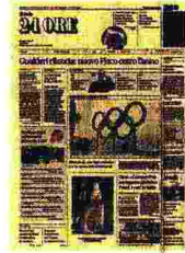
IL SOLE 24 ORE, 31 GENNAIO 2020, PAGINA 1