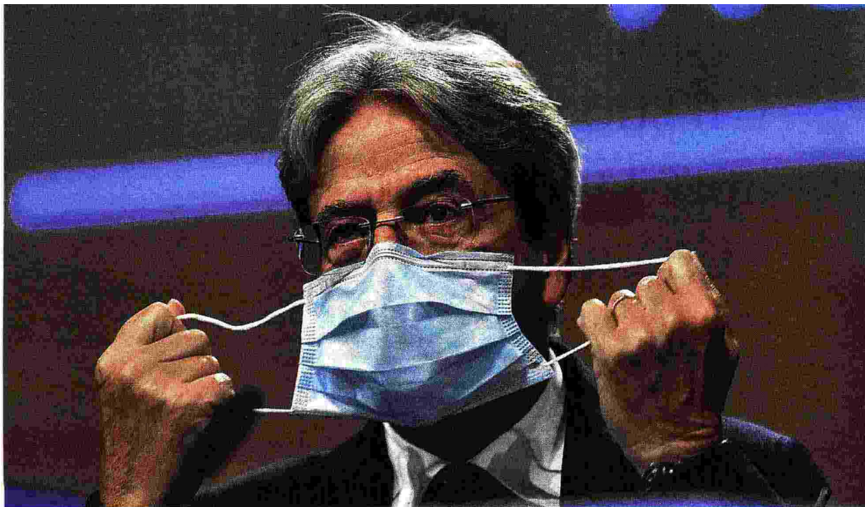
Paolo Gentiloni, 65 anni, è commissario europeo all'Economia dal 2019. In precedenza è stato presidente del Consiglio dei ministri della Repubblica Italiana dal 12 dicembre 2016 al 1° giugno 2018, ministro delle Comunicazioni nel governo Prodi II e ministro degli Affari esteri nel governo Renzi.