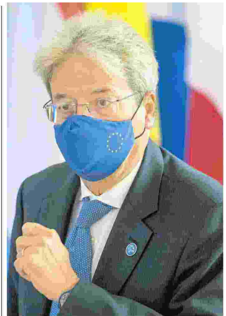
◀ Ex premier e ministro Paolo Gentiloni, commissario Ue agli Affari economici dal 2019, è stato premier italiano e ministro degli Esteri

Dal vaccino anti Covid una lezione sull'importanza di valori europei come scienza e trasparenza che escono vincitori. È un grande passo avanti per tutto l'Occidente. — ” —