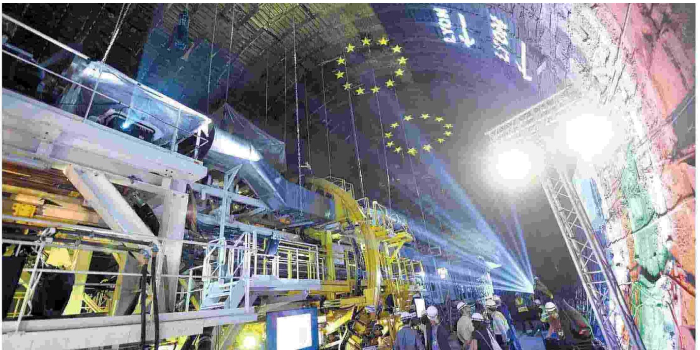
Gli scavi del tunnel per la TAV a Saint-Martin-La-Porte, in Francia: dopo il rallentamento dovuto alla pandemia, i lavori sono ripresi a pieno regime

Renderò Lione percorribile a piedi e in bicicletta al 100% e svilupperò i piccoli autobus