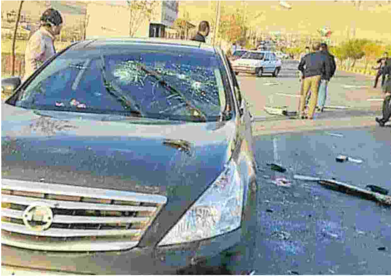
▲ L'agguato L'auto di Mohsen Fakhri-zadeh crivellata di colpi