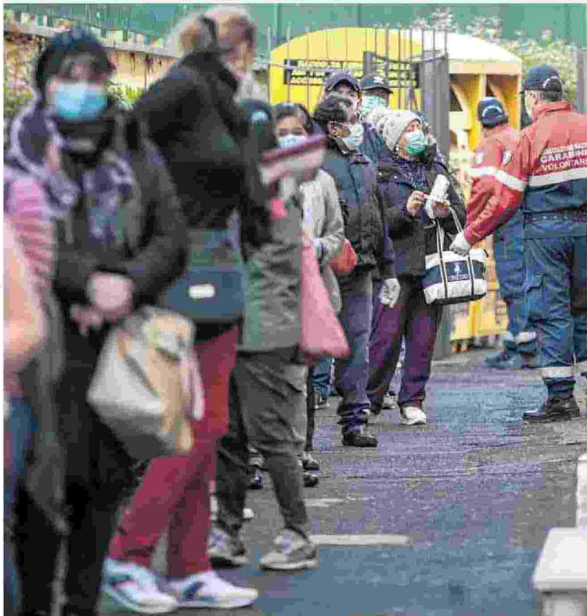
Salute, ricchezza e istruzione: il Covid aumenta le disuguaglianze nel nostro Paese