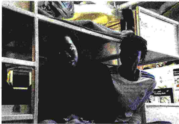
A bordo della Sea Watch

Ricostruire un'articolazione tra l'opposizione morale e un'opposizione politica che non c'è più e richiede una ricostruzione ab imis, diventa impellente e vitale