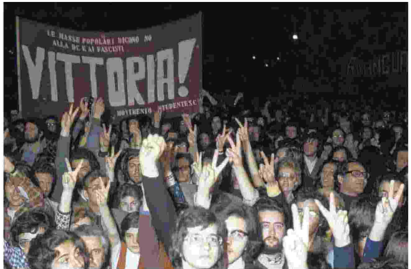
1974, primo referendum abrogativo in Italia: i no vinsero e la legge sul divorzio restò in vigore