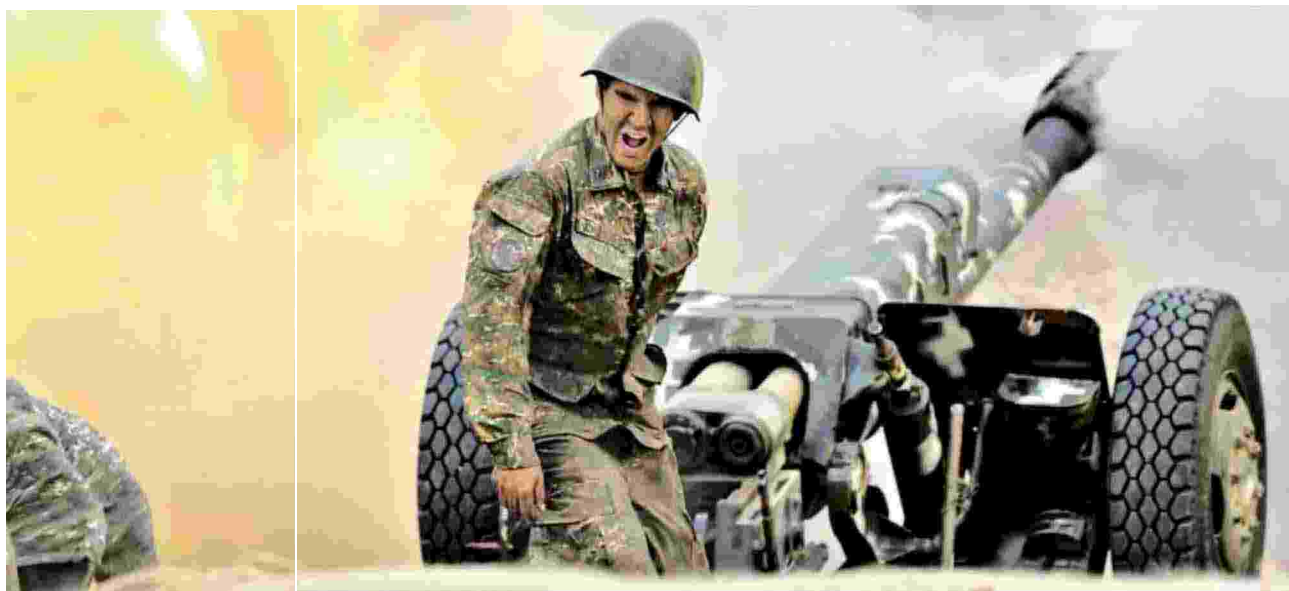
◀ I cannoni Un soldato di etnia armena durante i combattimenti contro gli azeri nella regione separatista