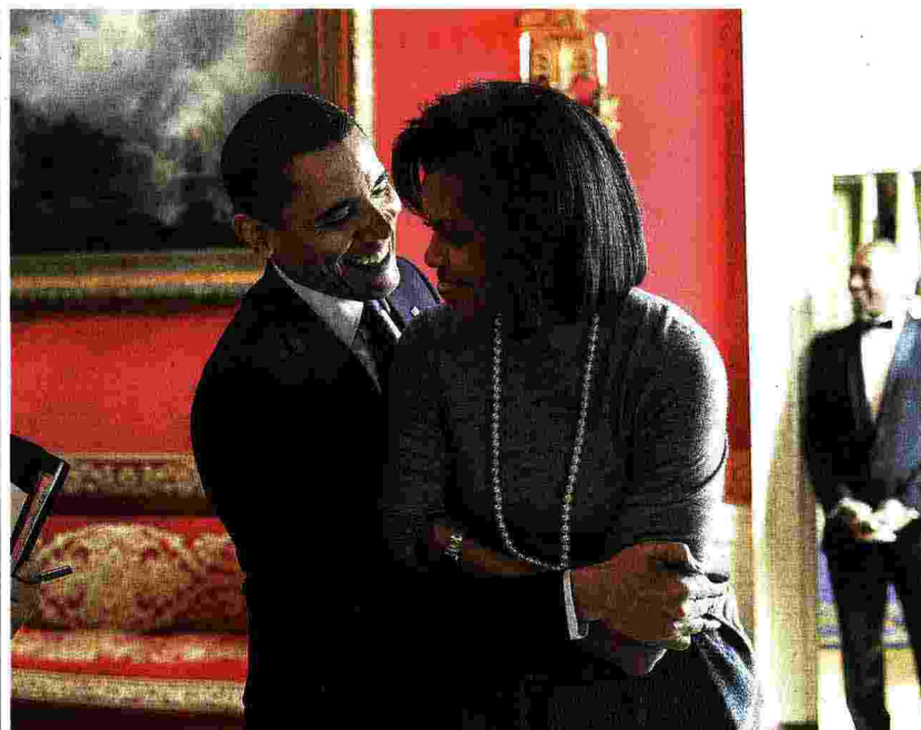
Insieme Barack Obama con Michelle alla Casa Bianca: sposati dal '92, hanno rispettivamente 59 e 56 anni. Due figlie: Malia, 22 anni, e Sasha, 19