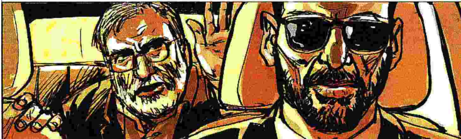
La ricostruzione ufficiale Auto di scorta in avanscoperta, risuona un rumore sordo. Lo scienziato ordina all'autista di fermarsi

Il percorso dell'aereo del premier israeliano Netanyahu da Tel Aviv all'Arabia Saudita, lo scorso 23 novembre