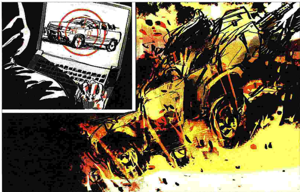
ILLUSTRAZIONI DI FRANCO PORTINARI

Tesi ufficiale Il camioncino con la mitragliatrice è fatto detonare dagli attentatori. Restano i rottami e pezzi di armi israeliane