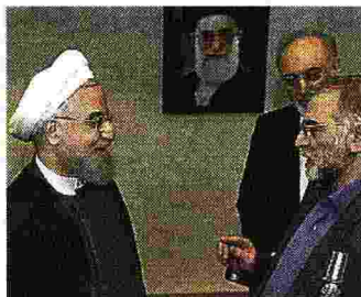
Medaglia Il premier iraniano Rouhani con Fakhrizadeh, al quale fu consegnato un riconoscimento dopo l'intesa sul nucleare del 2015