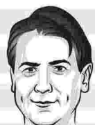
Fonte: Sondaggio Demos & Pi, Giugno 2020 (base: 1006 casi)