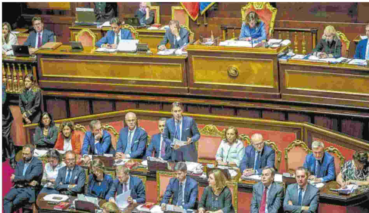
▲ Il secondo governo guidato da Giuseppe Conte

Tra i meno amati anche Mario Monti e l'ex segretario del Pd Matteo Renzi