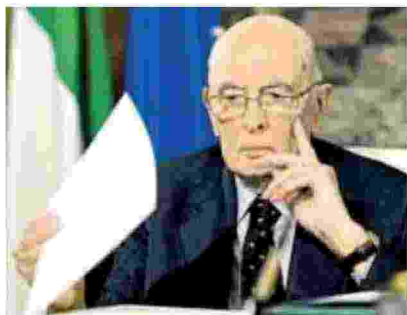
▲ Presidente emerito Giorgio Napolitano