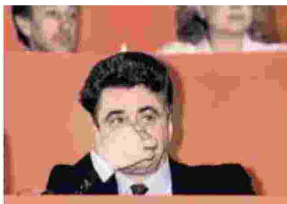
▲ In lacrime Occhetto dà l'addio definitivo al Pci al congresso del febbraio 1991