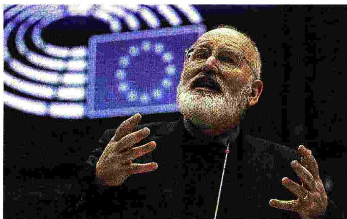
Vicepresidente Ue Frans Timmermans ha la delega al Green Deal

Il 21 luglio scorso il Consiglio europeo ha approvato Next Generation Eu, noto anche come Recovery Fund. Un pacchetto da 750 miliardi (390 sussidi e 360 prestiti) per aiutare gli Stati Ue più colpiti dalla crisi economica scatenata dal Covid-19. Per l'Italia si tratta di circa 209 miliardi