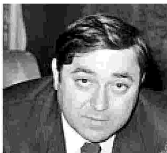
Walter Tobagi, ucciso il 28 maggio 1980

W alter Tobagi fu ucciso barbaramente perché rappresentava ciò che i brigatisti negavano e volevano cancellare. Era un giornalista libero, che indagava la realtà oltre stereotipi e pregiudizi, e i terroristi non tolleravano narrazioni diverse da quelle del loro schematismo ideologico.