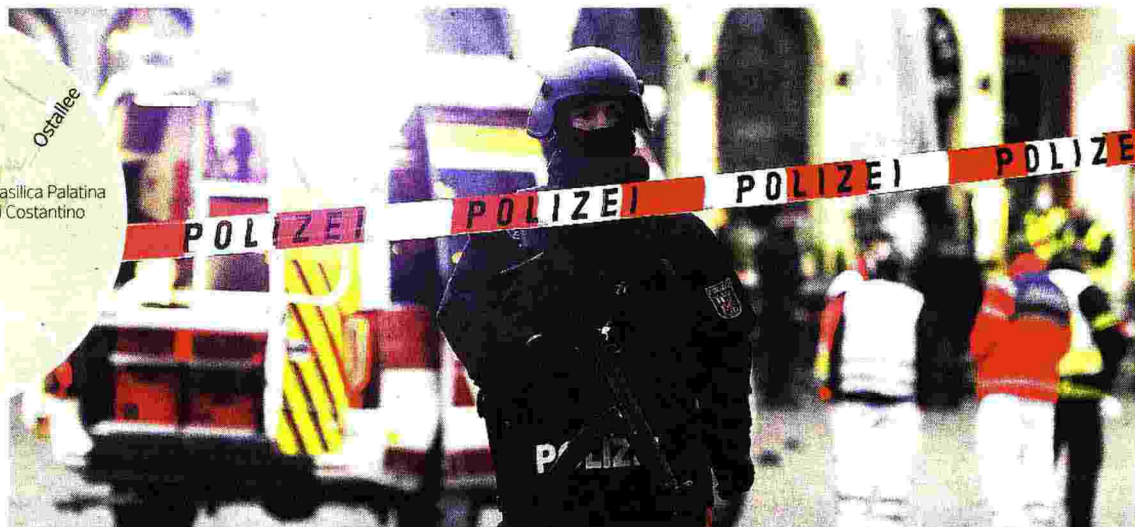
La corsa Il centro di Treviri cordonato dalla polizia dopo la strage: l'assaltore ha proseguito a zig-zag, come nell'intento di colpire il maggior numero di persone

dal nostro corrispondente Paolo Valentino