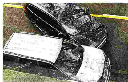
Ubricato L'auto usata per la strage: il guidatore, 51 anni, è stato arrestato dopo 4 minuti, ubriaco. Dalle prime indagini pare che visse nell'auto

Quattro vittime in Germania. Arrestato un 51enne: escluso il terrorismo