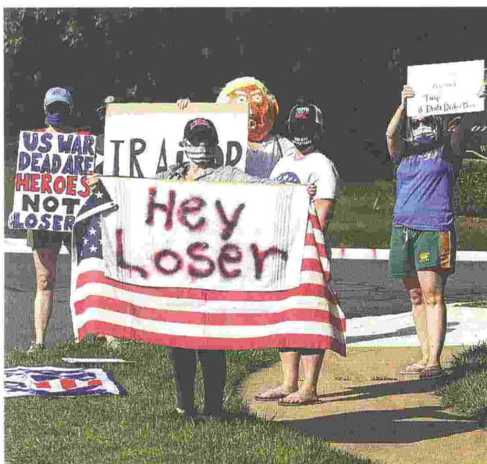
La protesta Alcuni manifestanti contestano il presidente fuori dal Trump National Golf Club di Sterling, Virginia

● Fra i reporter che hanno trovato conferme c'è Jennifer Griffin di Fox News, di cui il presidente ha chiesto il licenziamento via Twitter