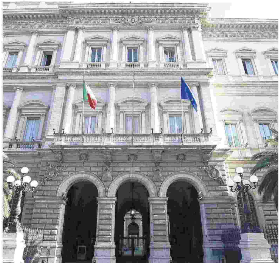
Palazzo Koch, sede della Banca d'Italia a Roma

La politica non sia divisa. Serve un paese unito. I virus non sono di parte e non rispettano le frontiere