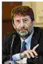
Il ministro Dario Franceschini

«Con profonda tristezza apprendo della scomparsa del professor Vittorio Gregotti. Un grande architetto e urbanista italiano che ha dato prestigio al nostro Paese nel mondo. Mi stringo alla famiglia in questa triste giornata», ha dichiarato il ministro per i Beni e le attività culturali e per il turismo, Dario Franceschini. Sulla dimensione sociale dell'architettura, evocata da Franceschini, Gregotti si