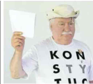
▲ Lech Walesa, 76 anni

«Abbiamo vissuto tempi in cui ogni nazione europea partecipava a una corsa tra ratti tra Stati nazionali. Era l'era delle guerre. Quella retorica funzionava in quel contesto. È