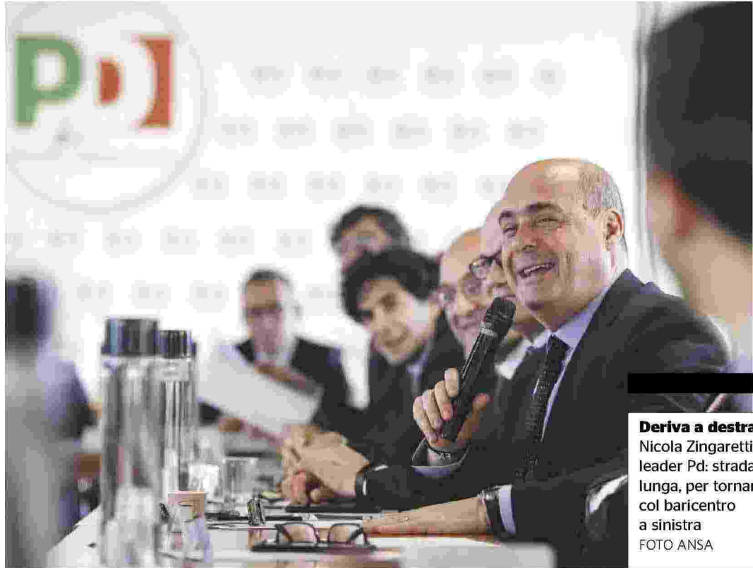
Deriva a destra Nicola Zingaretti, leader Pd: strada lunga, per tornare col baricentro a sinistra

"NON C'È ALTERNATIVA": per anni è stato il mantra della destra, accettato a sinistra. Il mercato come unica soluzione possibile, lo Stato attento solo al bilancio. Una scelta ineluttabile, dunque, lo smantellamento della sanità e la riduzione dei posti letto in terapia intensiva. Ineluttabile, come la scelta di Martina di abbandonare gli studi di Scienze dei Beni Culturali. Del resto, per lei sarebbe stato ineluttabile un destino di precariato e paga bassa. Se solo la sinistra avesse lottato prima per il diritto allo studio: a quante Martina stiamo rinunciando?